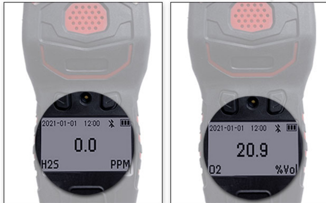
<가스 장착 예시>

※ 장착가능한 모든 가스는 상세페이지 하단의 가스성분표 참고 부탁드립니다.