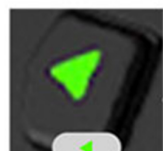
메뉴 및 뒤로가기 버튼