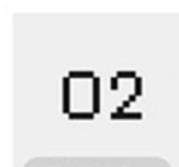
O2 Measuring Gas 측정가스