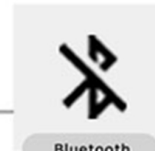
Bluetooth 블루투스 연결