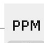
PPM 측정단위 표기