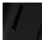
Bracket 교정캡 고정 위치