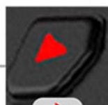
전원 및 OK 버튼