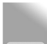
Backlight display 백라이트 디스플레이