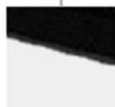
연결부 전용 충전기